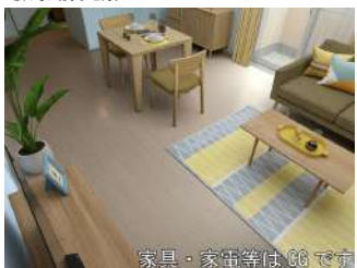
LDK 14.5帖 ※家具家電はCGです。実際には設置されておりません。 キッチン (IHコンロ付)